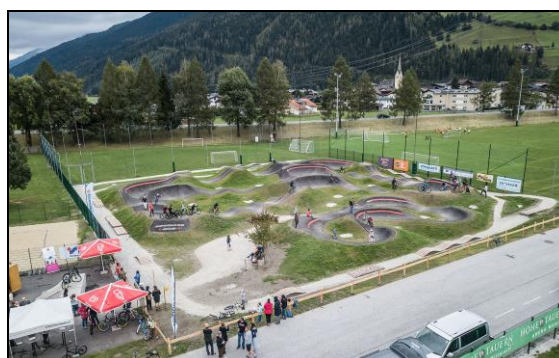
Imágenes de diferentes instalaciones de PumpTrack

Un Skate park es una instalación deportiva diseñada específicamente para la práctica de skateboarding con el objetivo de dar a los skaters y rollers una zona donde realizar trucos o piruetas en condiciones óptimas.